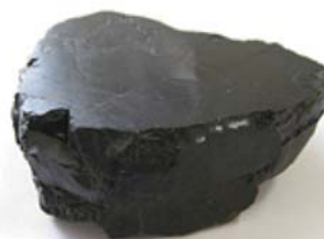
樹炭・・・石炭層中に含まれる炭化木

愛光エネルギーでは、お客様に満足いただける体制を常に追求しておりますので、当社にお任せ頂ければ安心です。