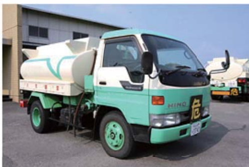
弊社小型タンクローリー

四国各県(愛媛県・高知県・香川県・徳島県)はもちろん、全国各地へ配送いたします。